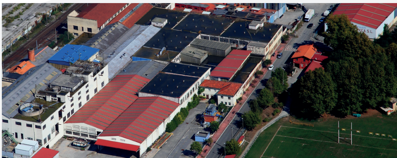
PLANTA COMINTER TISÚ, S.L. en Hernani (Gipuzkoa)