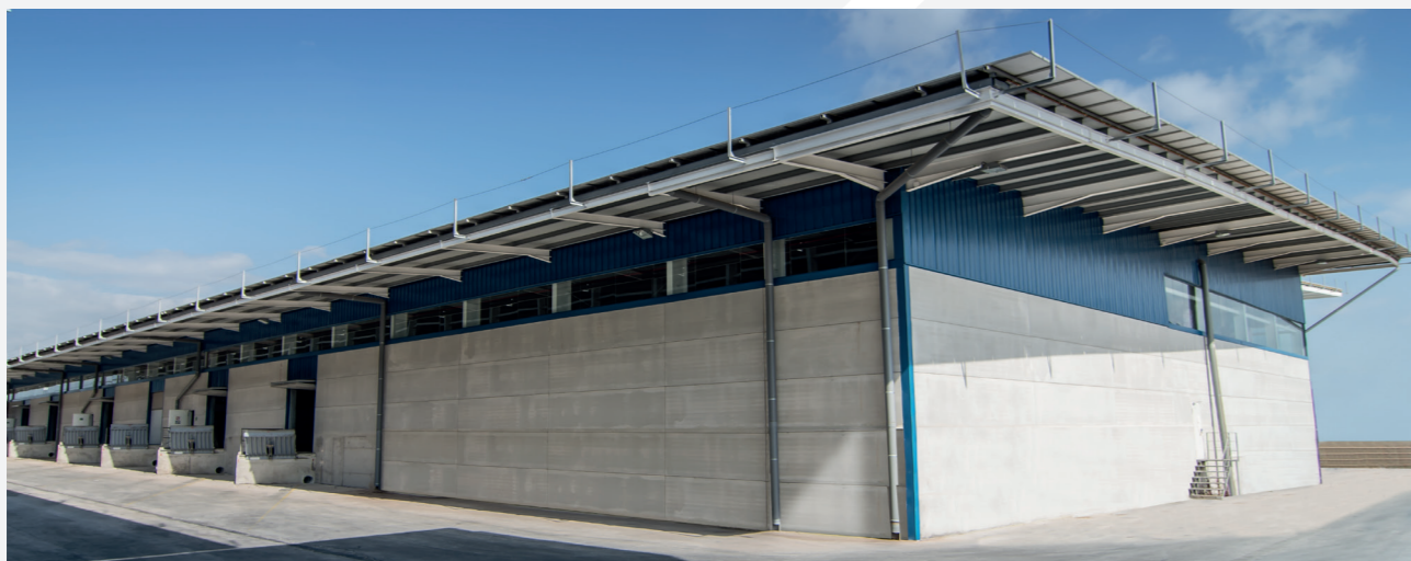
PLATAFORMA LOGÍSTICA en Onda (Castellón)

En Grupo Cominter no sólo nos preocupamos por el medio ambiente, sino que también nos ocupamos de él. Actuamos directamente sobre los principales ejes de la industria en materia de sostenibilidad: