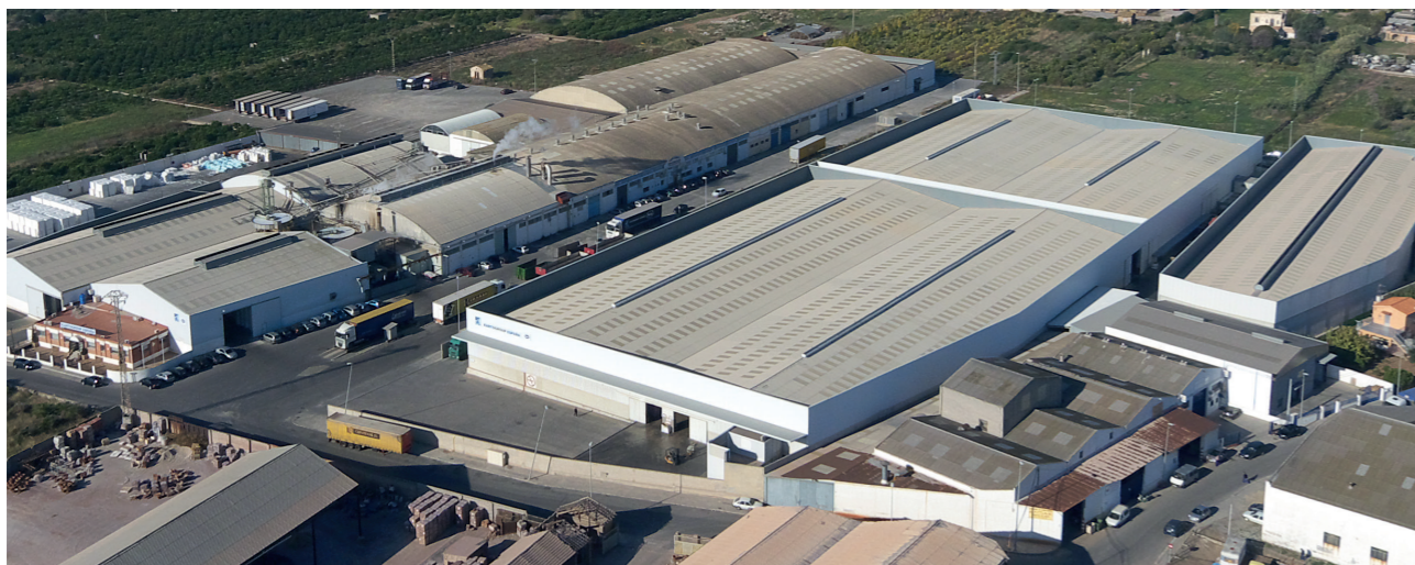
PLANTA KARTOGROUP ESPAÑA, S.L. en Burriana (Castellón)